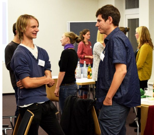
Bürgerforum Junge Generation

Die Foren starteten jeweils am Freitagabend um 18 Uhr und endeten am Sonntagmittag um 13 Uhr. Das Konzept für den Ablauf setzte insgesamt auf eine diskursive, eigenverantwortliche Arbeitsweise der Bürger/innen.