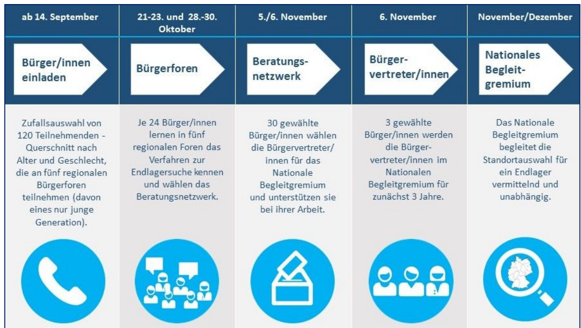
Abbildung: Zeitlicher Ablauf bis zum ersten Treffen des Nationalen Begleitgremiums in 2016

Nach dem StandAG hat die Bundesumweltministerin die Aufgabe, drei Bürger/innen für die Mitarbeit im Nationalen Begleitgremium (NBG) zu benennen, die zuvor in einem dafür geeigneten Verfahren der Bürgerbeteiligung nominiert worden sind.